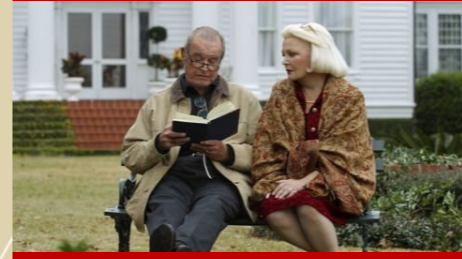
Rice Hope Plantation, Georgetown