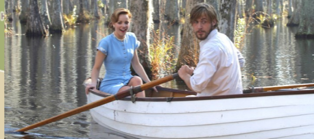
Cypress Gardens, Moncks Corner