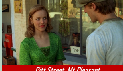
Pitt Street, Mt Pleasant