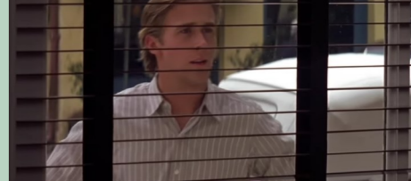
High Cotton Restaurant, Bay St., Charleston