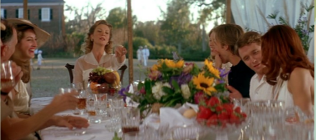
Boone Hall Plantation, Mt Pleasant