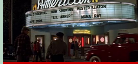
American Theatre, King St., Charleston