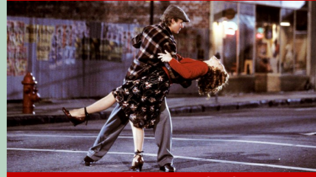
Angle de King St. et Mary St., Charleston