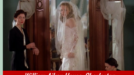
William Aiken House, Charleston