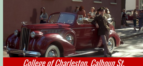
College of Charleston, Calhoun St.