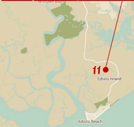
11. La maison du père de Noah.